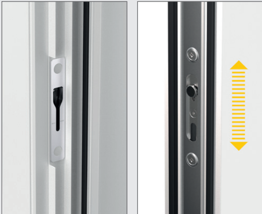
Offenstellung | open position