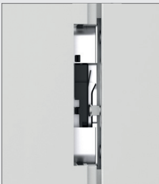
Verriegelte Position | locked position